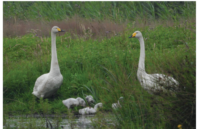
✧ Wilde zwanenpaar met jongen in het Fochteloërveen.

Spectaculair is de vestiging van Koereigers in De Wieden Ov. Op 1 juni werden drie bezette nesten gevonden in een prachtige kolonie met Purperreigers (154 nesten), Grote Zilverreigers (81), Blauwe Reigers (65), Aalscholvers (34), Kleine Zilverreiger (1) en mogelijk Kwak (1). Op 6 augustus werd er een jonge Koereiger gefotografeerd (Natuurmonumenten). Dit betekent, eindelijk, het eerste