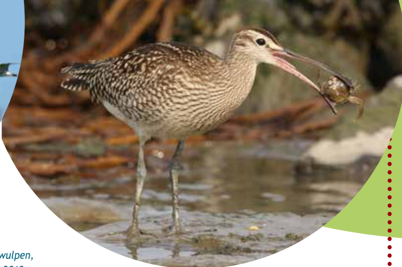
Invallende groep Regenwulpen, Noord-Holland, 14 april 2019.