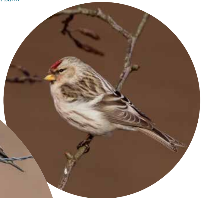
De Witstuitbarmsijs liet zich wekenlang fraai bekijken in Arnhem.