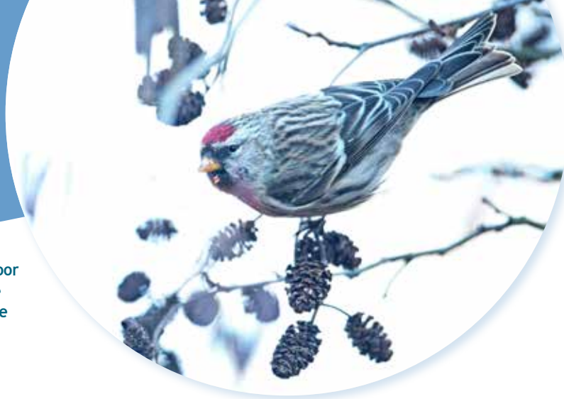
Grote Barmsijs, Oosterwolde Fr.

Heb jij ze ook gezien, de barmsijzen? Deze winter kenmerkte zich door een invasie van barmsijzen, met name de uit het noorden afkomstige Grote Barmsijzen. Vanaf oktober vorig jaar werd duidelijk dat er forse aantallen barmsijzen op zoek waren naar nieuwe voedselbronnen. De aantallen liepen snel op in november en december. En ze kunnen van ver komen, zo blijkt.