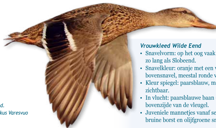
Wilde Eend.