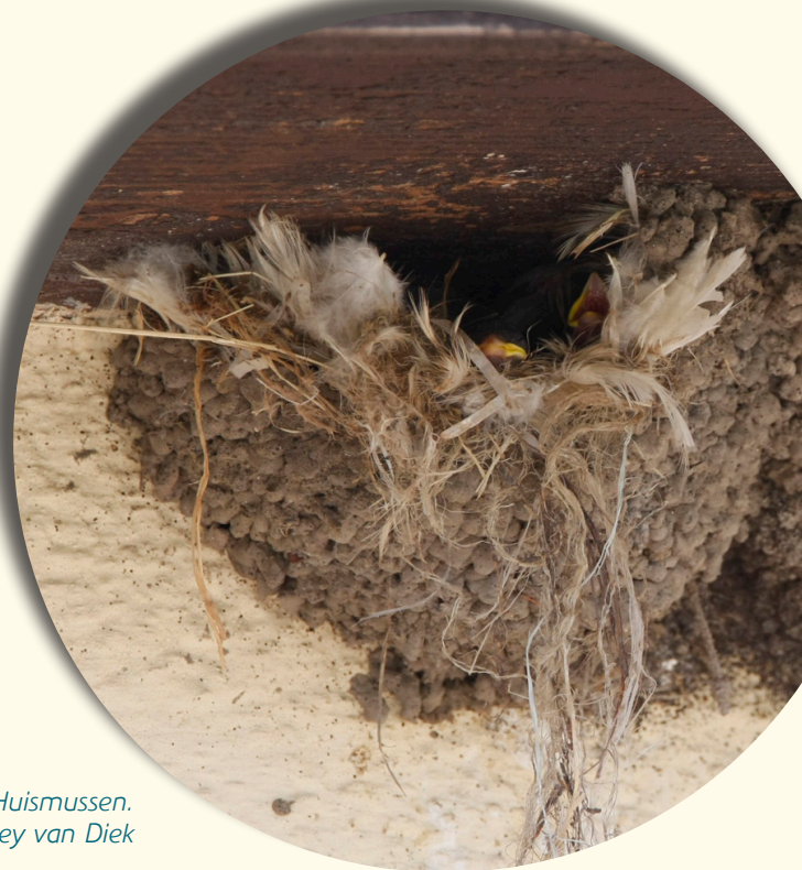
Nest dat gekraakt is door Huismussen.