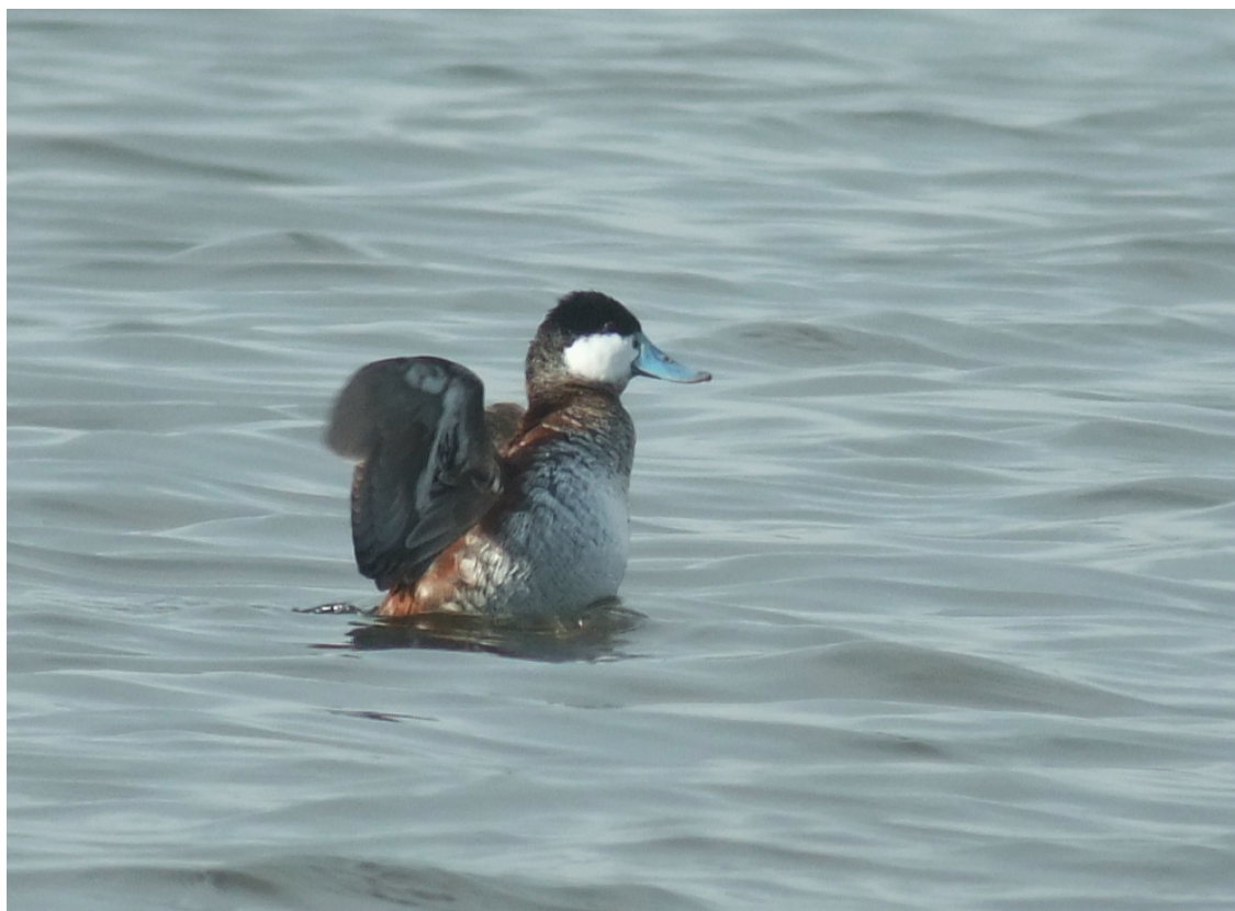
Rosse Stekelstaart mannetje(s) 17-2-2011 Starrevaart, Leidschendam