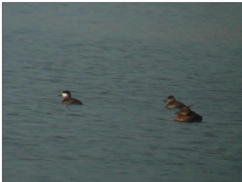
Rosse Stekelstaart man en vrouw (met vrouwtje Wilde Eend), 22-2-2011 Veerse Kreek