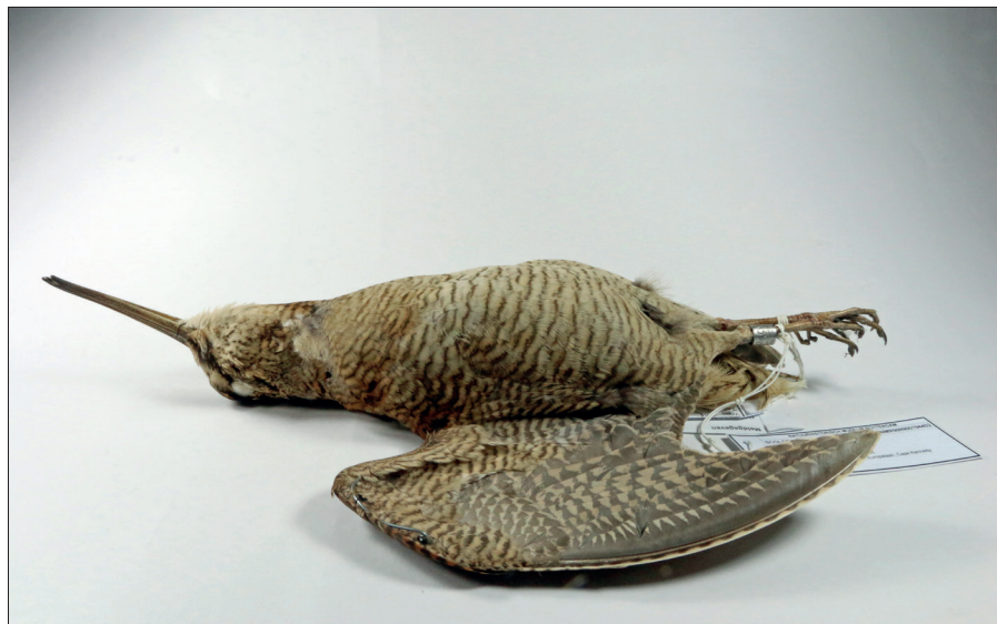
▲ De tien jaar oude houtsnip met ring VTA 3.556.392 is geprepareerd als studiehuid met gestrekte rechtervleugel; NMR998900194402.