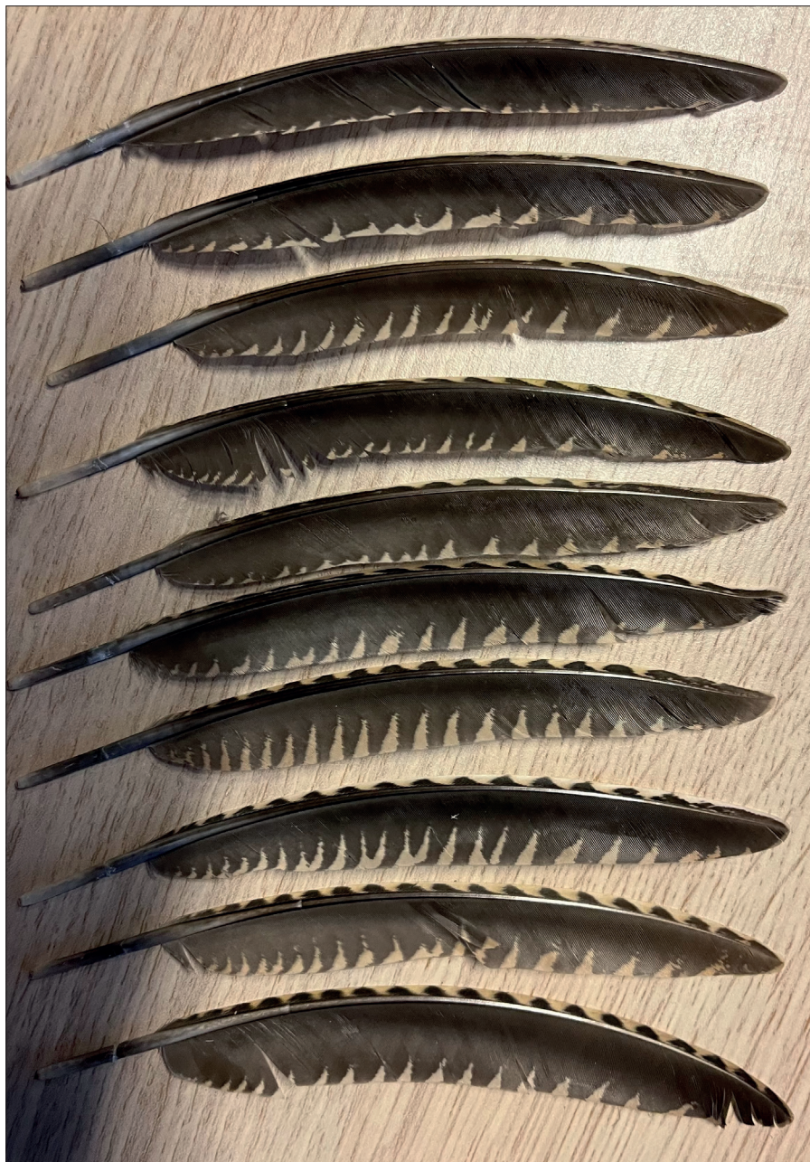
▲ Variatie in kleur en tekening bij de buitenste slagpennen van 10 vrouwelijke houtsnippen in november (2022) van hun eerste kalenderjaar. (Erwin Kompanje)

of zelfs maar in de richting komend van een crèmekleurige buitenvlag. Het is dus ook een totaal onbruikbaar criterium voor geslachtsbepaling.