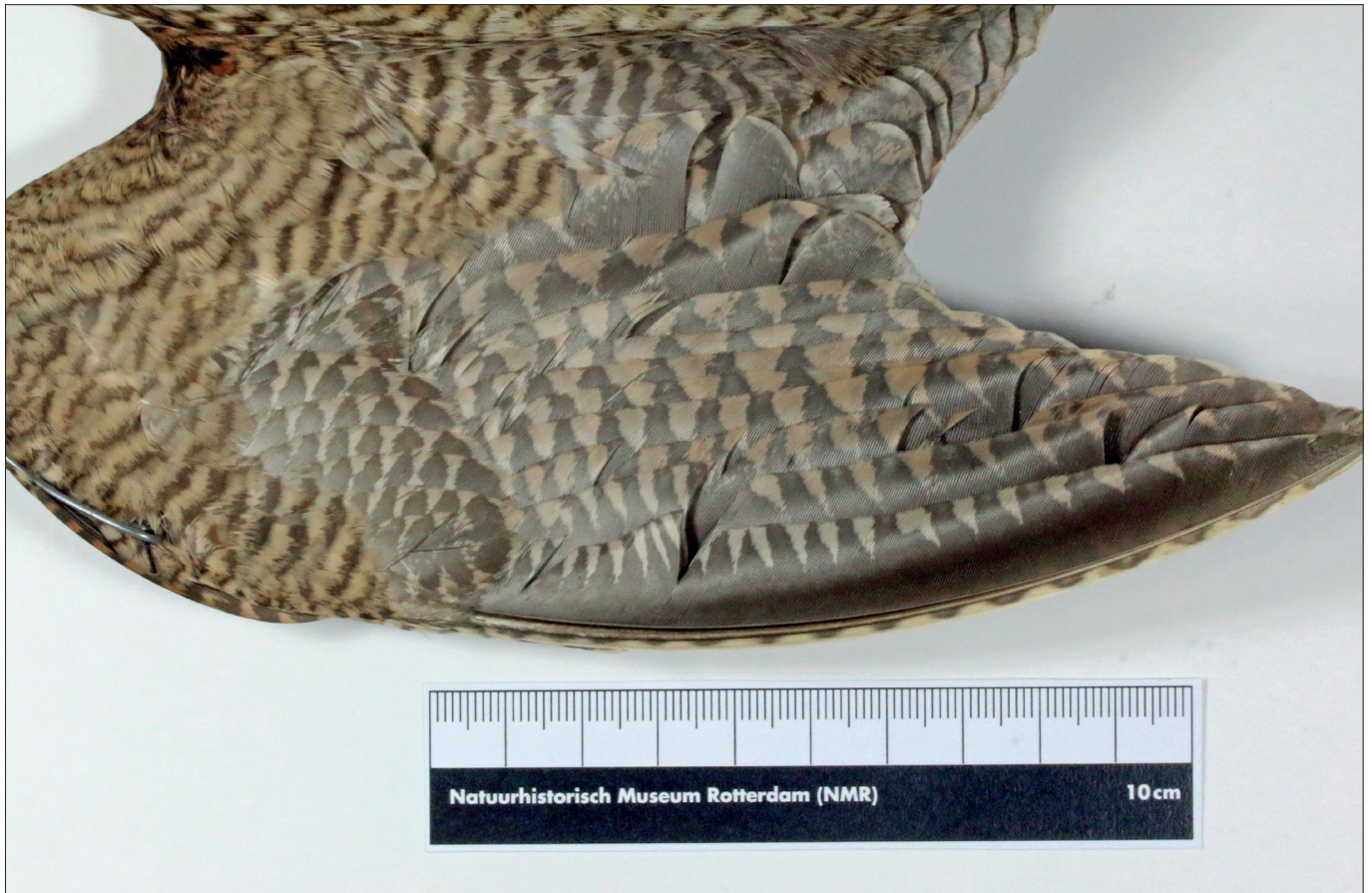
▲ ► Vleugel van houtsnip NMR998900194402 met rechts detail van de buitenvlag van de buitenste slagpen.