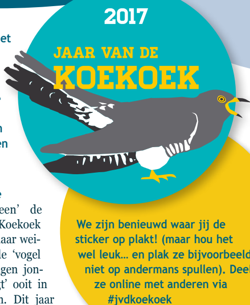
Koekoek, Muy Slufter, Texel, 8 mei 2016.