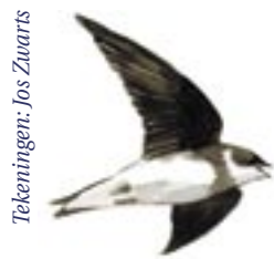
Tekeningen: Jos Zuwaerts

Lokale factoren in de broedgebieden kunnen het overall-effect van de Sahel verscherpen of verzachten. Dat de Nederlandse populatie niet geheel herstelde, heeft ongetwijfeld te maken met het verdwijnen van natuurlijke waterstandschommelingen in moerassen en intensivering van agrarisch cultuurland. Omgekeerd groeide de kolonie in de Zouweboezem in de herstelfase veel sterker dan de Nederlandse populatie als geheel. Dit kan worden toegeschreven aan lokaal terreinbeheer. Dit verbeterde de lokale reproductie maar trok ook vogels aan die anders elders zouden hebben genesteld.