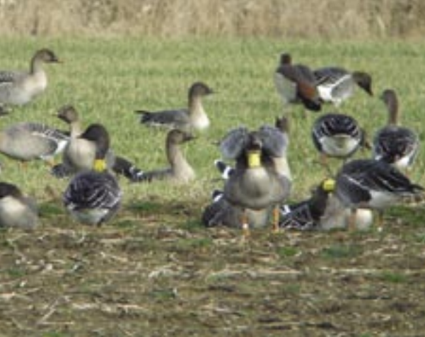
Gehalsbande Toendrarietganzen bij Bergen (Li.).

op 28-30 januari in De Peel (Egbert van der Linden, Jeu van Rijswick).