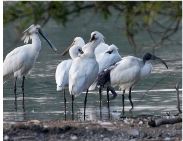
Heilige ibis tussen lepelaars, Oude Waal (Gld).

Buiten de broedtijd zijn tot maximaal rond de 33 vogels vastgesteld in Nederland, medio jaren 2000. Het patroon van de aantallen in de tijd sluit behoorlijk goed aan met de van de broedvogels, maar de waarnemingen zijn gedaan in